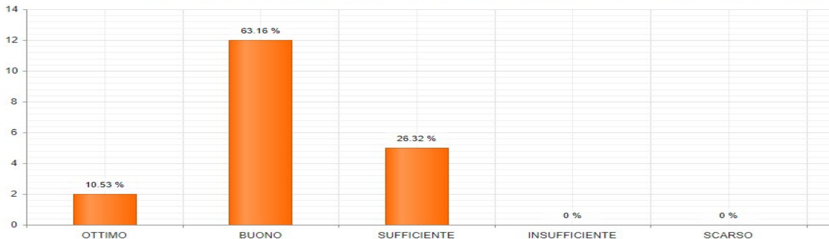
Come valuta il miglioramento della attività svolte dai suoi collaboratori dopo la partecipazione al corso?